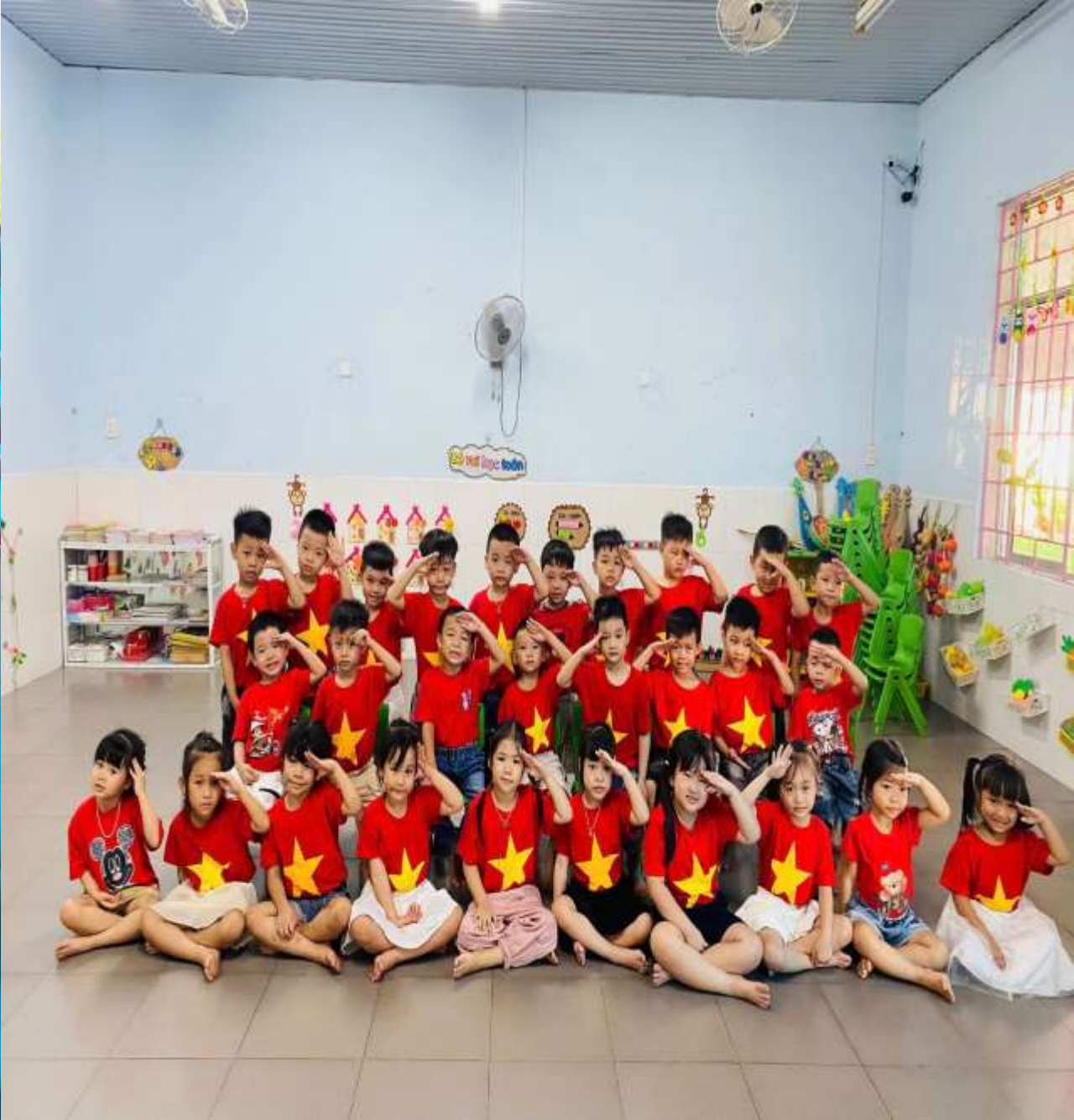
Hình ảnh: Trẻ mạnh dạn, tự tin hơn khi tham gia các hoạt động cùng bạn