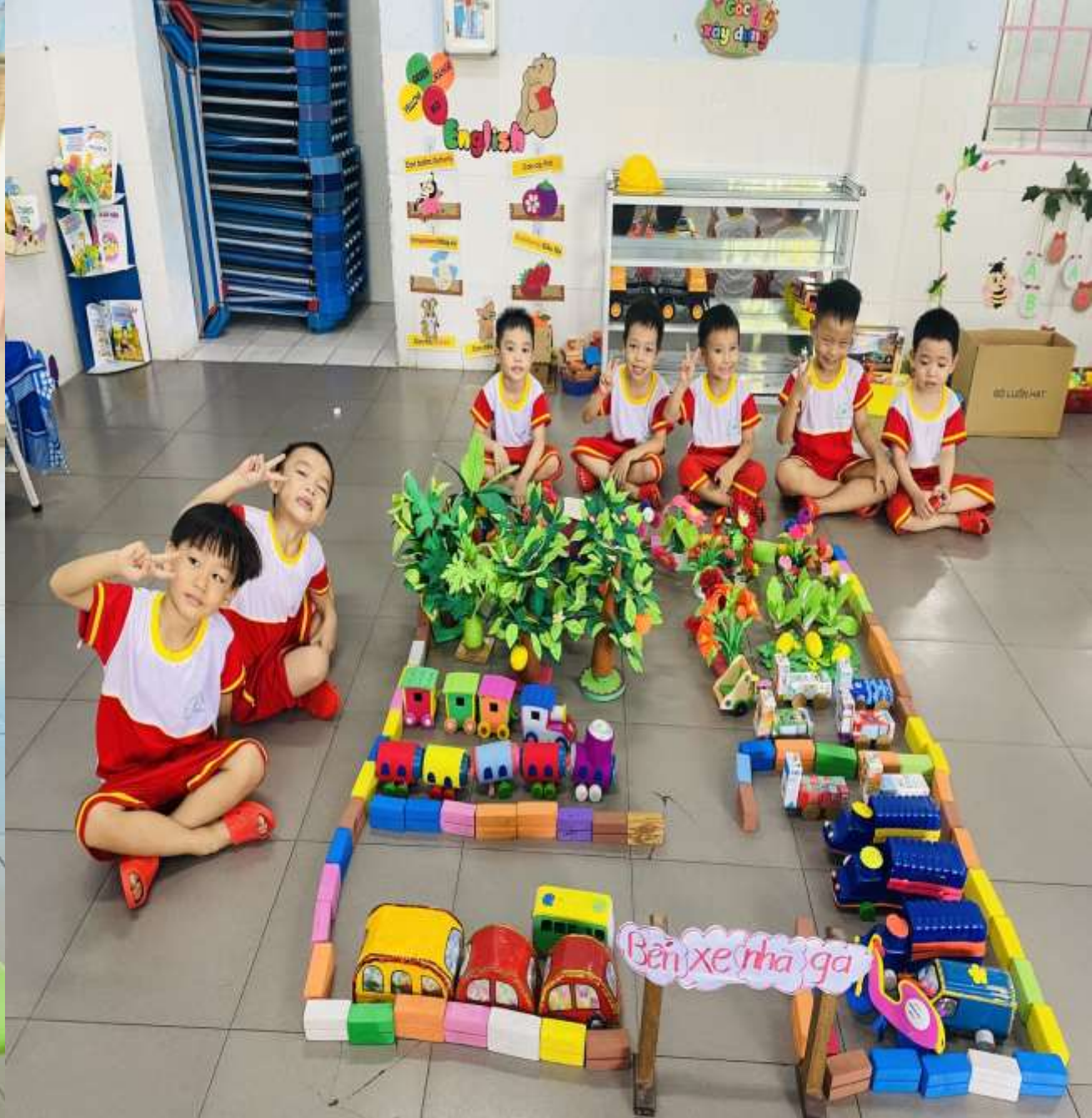
Hình ảnh: Trẻ đoàn kết và chơi vui vẻ với bạn